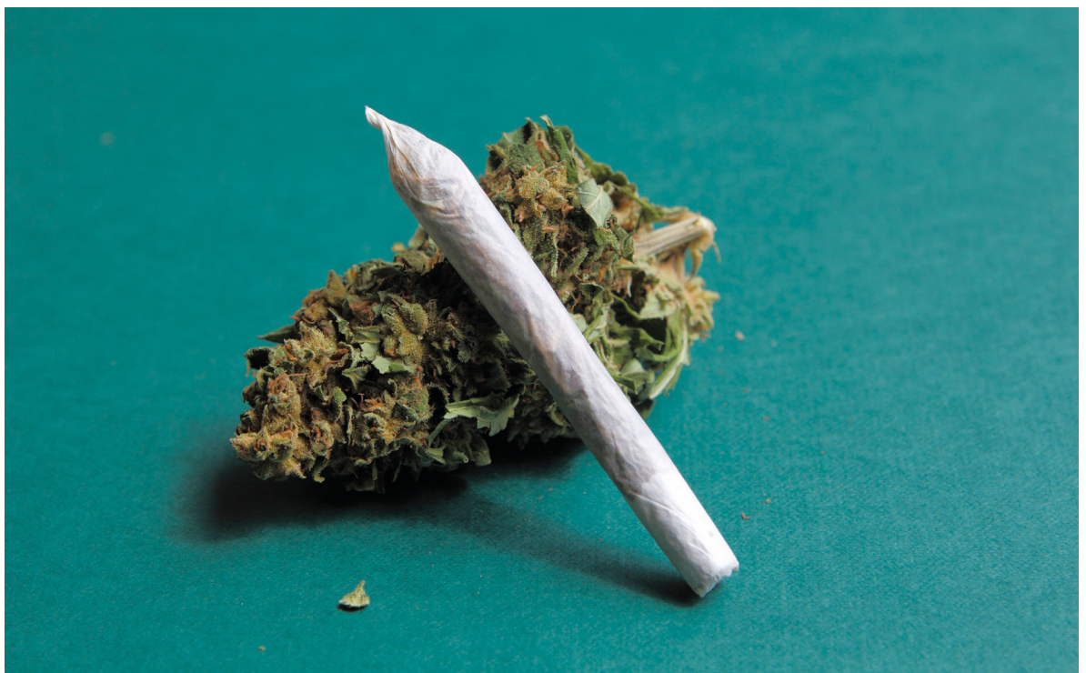
roken van cannabis in joint, puur of met tabak