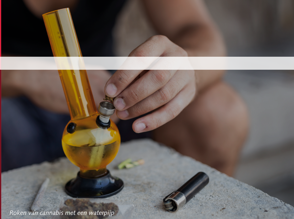
Roken van cannabis met een waterpijp